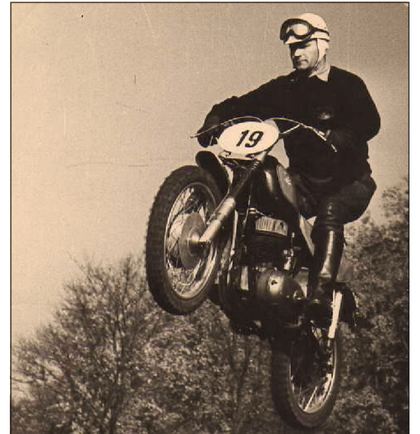
Az édesapja hétszeres motocross bajnok volt