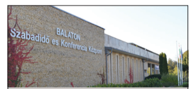
BALATON SZABADIDŐ ÉS KONFERENCIA KÖZPONT B.FÜRED, HORVÁTH M. U. 64.