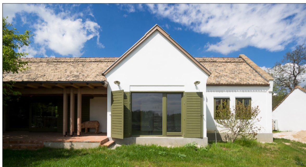
„Az Év Balatoni Lakóháza” díjat a tavalyi pályázaton egy balatonhenyei családi ház kapta