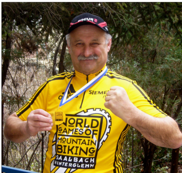
Kategóriájának győzteseként a Saalbach-ban rendezett amatőr kerékpárversenyen

- Vagyis közel három évtizede dolgozik a kerékpározás ügyén.