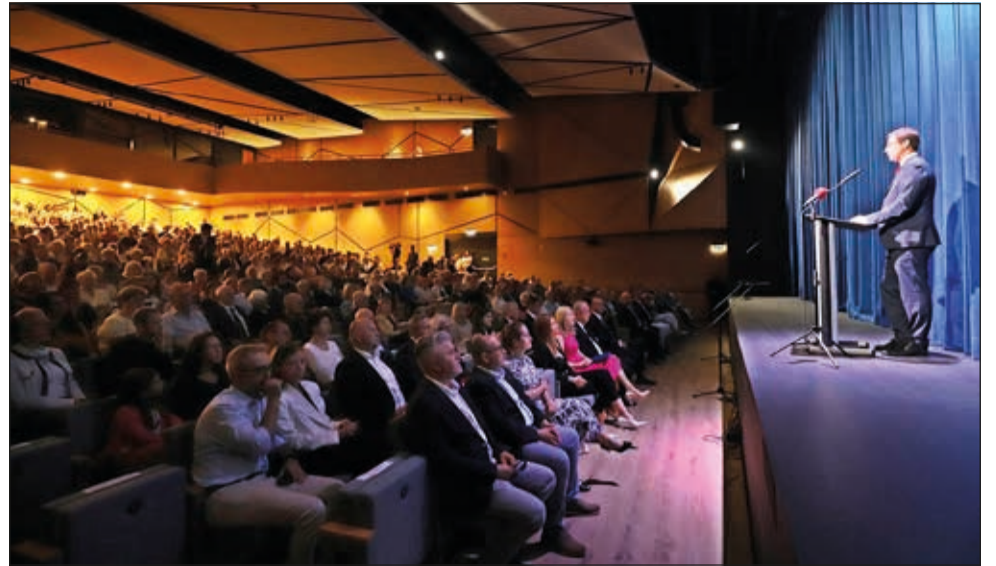
A Balatonfüred Kongresszusi Központot Gulyás Gergely miniszter nyitotta meg

Sokan osztoztak a város vezetéssel abban az örömben, amit a Balatonfüred Kongresszusi Központ megnyitása jelentett. Az új épület felhelyezi Balatonfüredet a konferenciaturizmus térképére és olyan kulturális előadásokra ad lehetőséget, ami eddig nem lehetett a térségben.