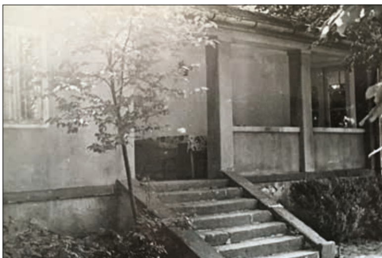
A Cholnoky nyaraló egykoron