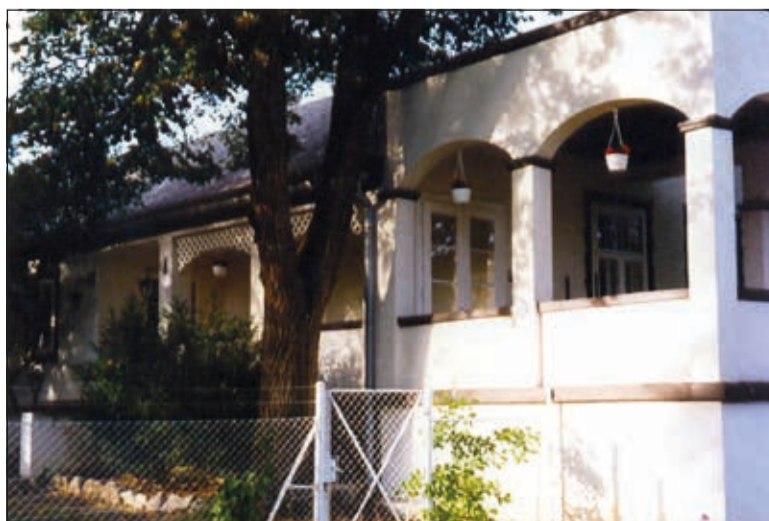
A Cholnoky nyaraló napjainkban