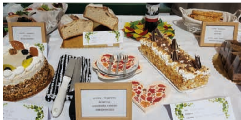
Az ifjú mester kategóriában díjat kapott Tompos Kira, aki több süteménnyel is nevezett a versenyre

10 db nagyobb házi tojást kettéválasztunk, a fehérjéből kemény habot verünk. A sárgájához 40 dkg porcukrot és 10 dkg puha vajot jól összedolgozunk. Ehhez a krémhez keverünk még 40 dkg őrölt mákot, egy csipet sót, egy makkáskanálnyi őrölt szegfűszeget, 2db bio citrom reszelt héját és a felvert tojásdobot. Sütőbe tesszük, 175 fokon, 2db 26 cm átmérőjű tortasütőben 40 percig sütjük. Amikor langyosra hűlt bőségesen megkenjük sűrű, rumos házi szilvalekvárral. A tetejére 20 dkg porcukorból, bio citromlével sűrűn folyós mázat keverünk és a torta tetejére csorgatjuk.