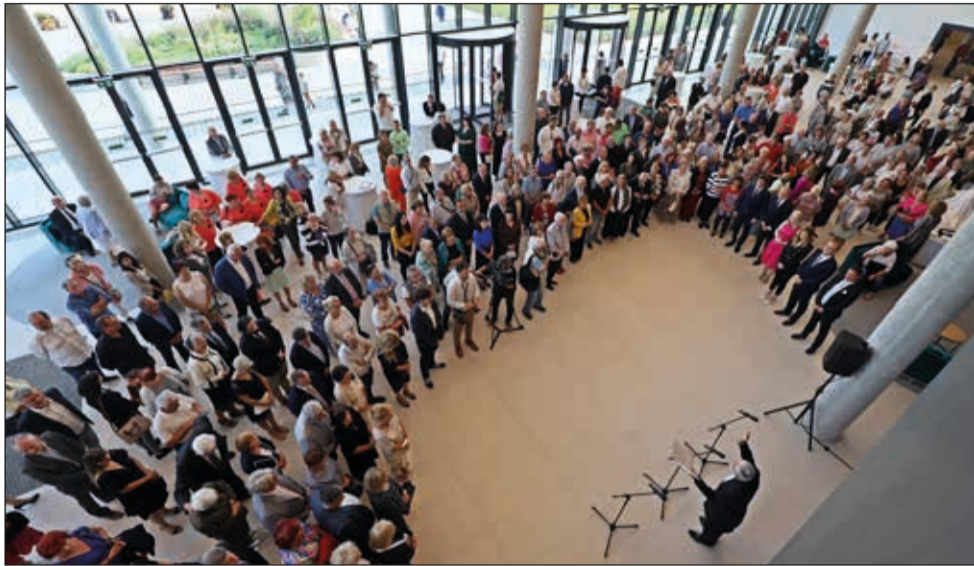
Az új épület 1200 fős rendezvényeknek adhat otthont