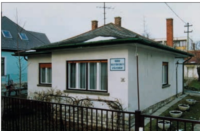
Az Arany János utcában 1993-tól kapott helyet a gyűjtemény

Nyugodtan lehet állítani, hogy a gyűjtemény igazi szellemi műhelylyé vált az eltelt több mint három évtized során: állományának sokszínűsége, eddigi tevékenysége, a munkatársak szakmaszeretete és hozzáértése, az új, modern, korszerű hely által nyújtott körülmények megfelelő alapot és lehetőséget jelentenek a jelenlegi és új feladatok ellátásához, megvalósításához a jövőben is. Tóth-Bencze Tamás