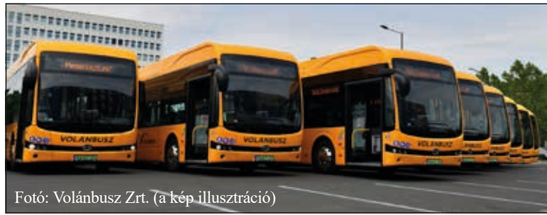
(a kép illusztráció)

Tovább folytatódik a sikeres Zöld Busz Program: a budapesti agglomeráció és hat megyeszékhely után hamarosan hat kisebb városban, köztük Balatonfüreden is alternatív meghajtású, környezetkímélő járművekkel korszerűsödhet a helyi közlekedés.